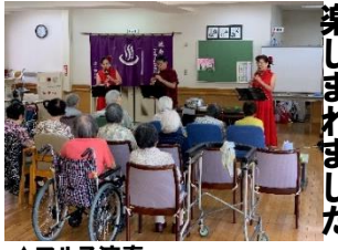
▲フルス演奏 ▼メイクアップ