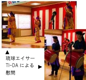
▲琉球エイサー TI-DA による慰問

今年 100歳が3名!! 敬老会で長寿のお祝いを： 九月一六日(日曜日)、特別養護老人ホーム延寿苑(＝特養)にて、ご利用者及びご家族をお招きして敬老会を開催した。 敬老会は、特養にとって年に一度の大イベントの一つであり、ご利用者の長寿を願い、またご家族との交流の場として毎年開催している。 第一部の式典では、一〇〇歳のお祝いを受賞されたご利用者が三名もいらっしや会場を驚かせた。第二部の演奏でも、職員による演奏、琉球エイサー、DAによる慰問賑やかな会となった。その後は、ご利用者とご家族が一緒に食事をする昼食会となり、遠方のご家族など中々お会いできないご家族とも一緒に食事ができ、楽しそうに過ごされ和やかなひと時となった。