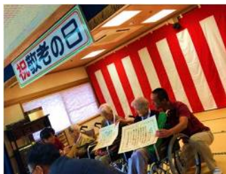
▲三名の受章者より一言